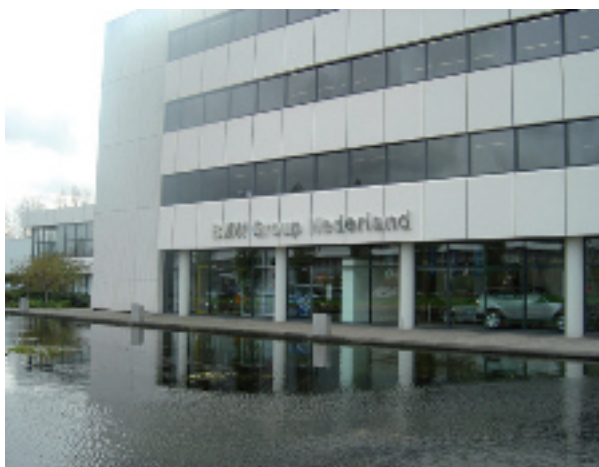
Toen BMW Group Nederland in Rijswijk in 2005 de beslissing nam om hun presentatieruimte te renoveren was er een snelle bouwtijd nodig.

De gepatenteerde ontkoppelingsmat van de martleider in systeemoplossingen voor tegel- en natuursteenplaatsing, die zich al bijna 20 jaar in de praktijk heeft bewezen, had daarbij nog meerdere functies te bieden, die uiteindelijk de doorslag gaven: