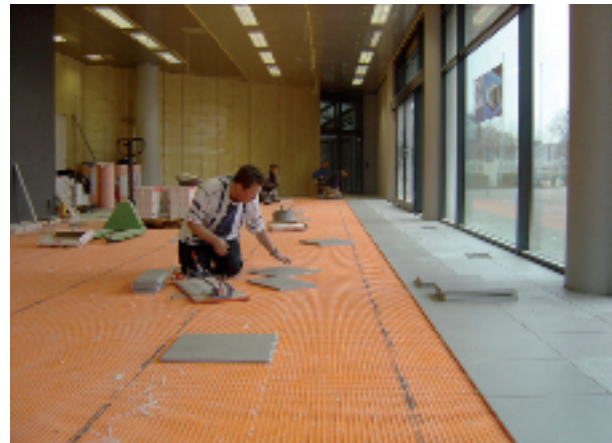
Direct na de DITRA-verlijming kon ook al met de tegel plaatsing - Floorgres Neway 45x45 /Gray & Black - begonnen worden.

Op de mat kan dan dadelijk met de tegelplaatsing gestart worden. De tussen de kwadratische verdiepte reliefs gelegen luchtkanalen laten de dampdruk uit de dekvloer verdwijnen.