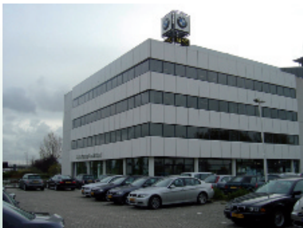
Toen BMW Group Nederland in Rijswijk in 2005 de beslissing nam om hun presentatieruimte te renoveren was er een snelle bouwtijd nodig.

Eén probleem kon de tegelzetter niet zo wegwerken: de fysische krachten van de verwarmde dekvloer die op elke temperatuurverandering met enige vervorming reageert. Daarom beslisten de vakmannen van Tombe & Karel, de Schlüter-DITRA ontkoppelingsmat te gebruiken, waarbij men eerst bij de fabrikant de geschiktheid van de mat op probleemondergronden informeerden.