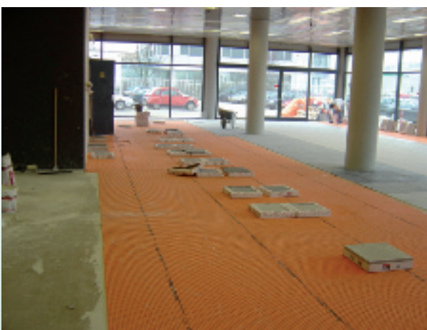
Direct na de DITRA-verlijming kon ook al met de tegel plaatsing - Floorgres Neway 45x45 /Gray & Black - begonnen worden.

Aan de achterzijde van de DITRA-mat vormen zich tussen de kwadratische verdiepte reliefs in alle richtingen communicerende luchtkanalen. Treden enkel tussen ondergrond en bekleding op basis van onderlinge vervormbare schijfspanningen op, zo worden deze luchtkanalen als 'bewegingsvlak' geneutraliseerd. Tegelijkertijd kan bij jonge dekvloeren over deze