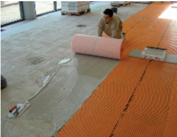
Ter verlijming van de Schlüter-DITRA in de BMW-presentatieruimte werd de dunbedmortel Eurocol 720 gebruikt, die met een 4x4 mm vertanding aangebracht werd.

Voorafgaand van de plaatsing is een vlakke en dragende ondervloer nodig. Indien nodig is een niveau gelijkmaking te repareren met een geschikte nivelleermassa.