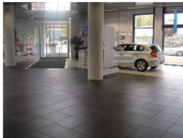
Omdat noch de fysische krachten van de ondergrond noch de hoogte van de belasting door de BMW modellen, die in de hal komen, aan de tegels schade kunnen veroorzaken

In verbinding met een vloerverwarming werken de communicerende luchtkanalen aan een snelle en vlakke warmteverdeling. En vormen zo een gelijkmatige temperatuurspreiding van het bekledingsoppervlak.