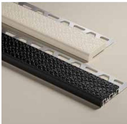
Kleurencombinatie GS met SP (hier TREP-V 42/12)