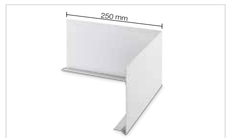
Buitenhoek: Schlüter®-BARA-FAP/E 90°

Opmerking: Als verbindingstuk raden we de naadafdekking Schlüter®-BARA-STU aan.