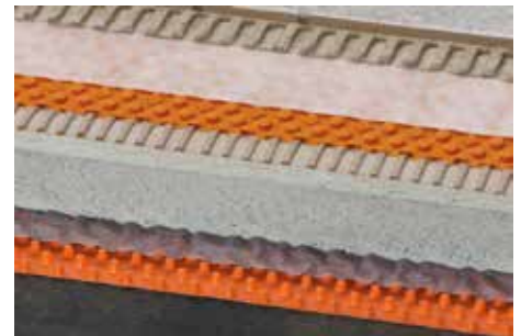
Schlüter-TROBA-PLUS 8 (12)

Art.nr.: _____ Materiaal: _____ €/m 2 Loon: _____ €/m 2 Totaalprijs: _____ €/m 2